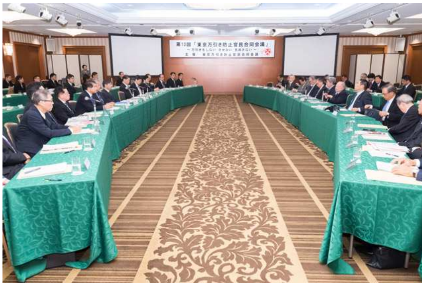
東京万引き防止官民合同会議の様子

(Metropolitan Police Department, Tokyo Metropolitan Government, trade association, etc.)