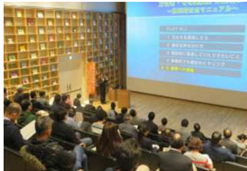
万引き防止のための防犯責任者養成講座の開催

東京万引き防止官民合同会議では、警察、自治体、業界・関係団体、学校、地域住民、ボランティア団体等と連携した、社会総ぐるみによる万引き防止対策に取り組んでおります。