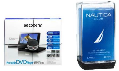
高いセキュリティ性 確実に商品を守る「アルファ」