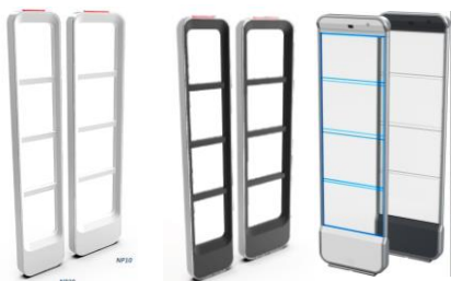
クラス最高の検知パフォーマンス 「NEO」

あらゆる業態の小売企業様にご支持いただき、万引きなどによる不明ロスの削減に貢献しています。