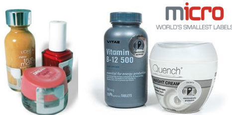
より小さなラベルで、高い検知力を発揮 商品管理ラベル「EPラベル」