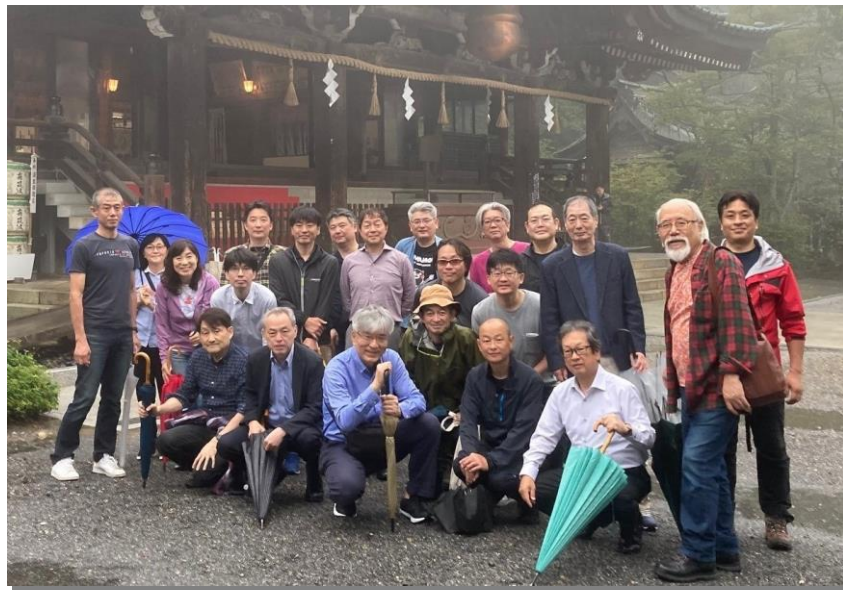
創立22周年行事 令和5年6月3日早朝 筑波山神社 雨上がる

～ 防犯民主主義実現に向けて ～ EAS 機器と防犯カメラとロス・プリベンション推進のための工業会