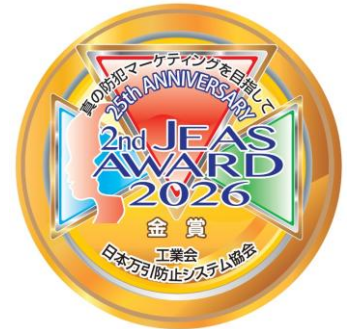
本年度の金賞デザイン